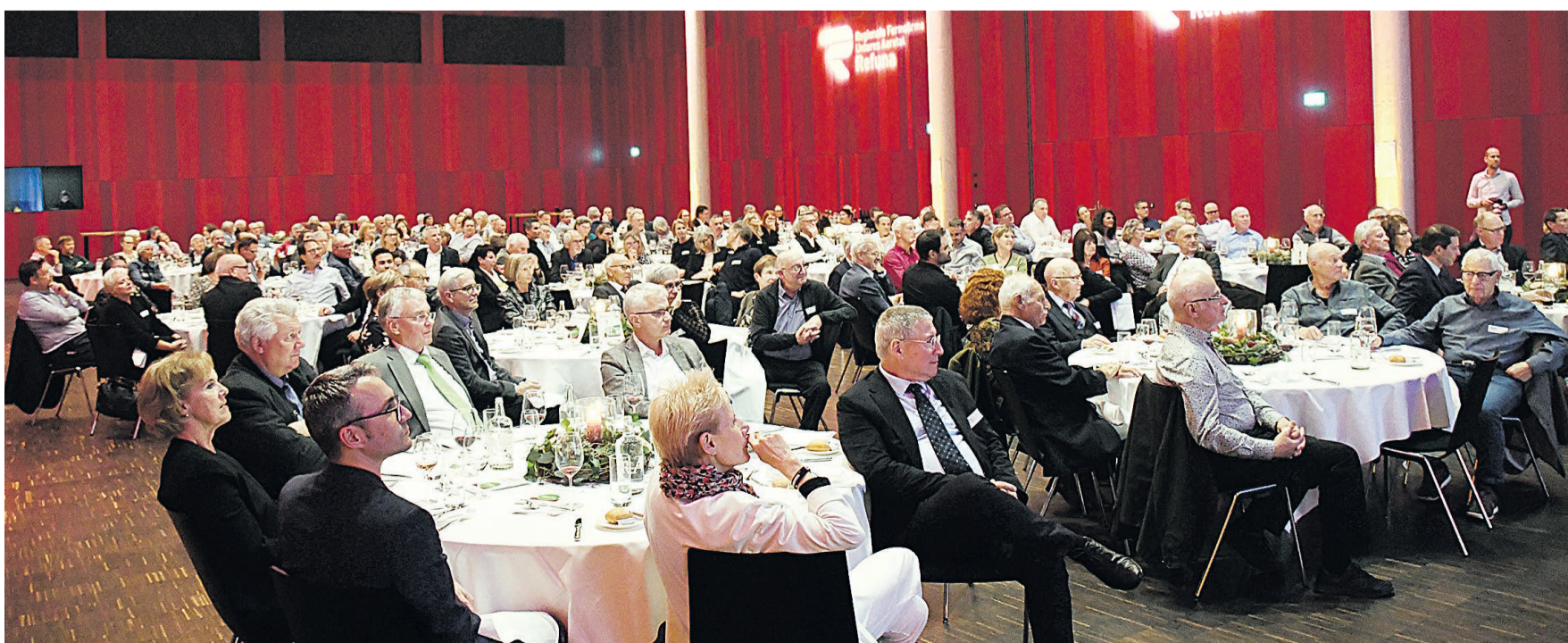
Über 150 Gäste, die auf die eine oder andere Art mit Refuna verbunden sind (oder waren), folgen der Einladung in den Campussaal.

Burkart schloss sein kurzes Plädoyer mit einem Votum zur Kernenergie: «Wir brauchen Kernenergie. Sie ist jederzeit verfügbar, sie ist günstig, sie sichert uns Autonomie.» Er gratulierte der Refuna zum 40-Jahr-Jubiläum und schloss mit der Feststellung: «Die Innovation von damals ist eigentlich auch heute noch eine Innovation. Hoffen wir auf viele Nachahmer.»